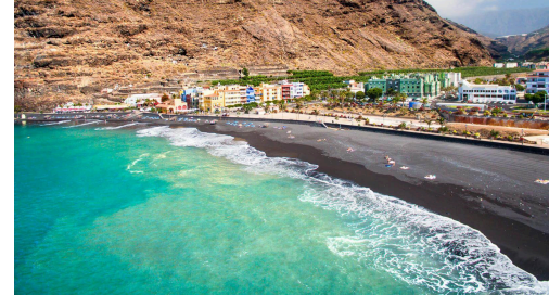
Playa de Tzacorte